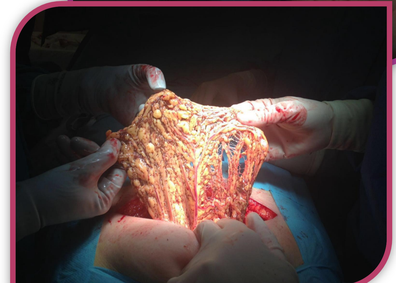
Imágenes 1y2 : Vista macroscópica durante cirugía